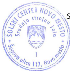
Sebastijan Brežnjak, univ. dipl. inž. ravnatelj

Izposojevalnina za komplet učbenikov iz učbeniškega sklada znaša 1/3 cene učbenikov in jo je potrebno poravnati s plačilom položnice.