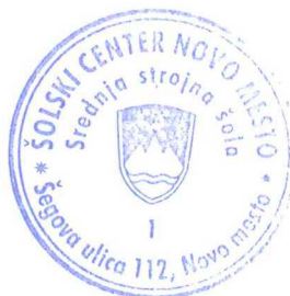
Sebastijan Brežnjak, univ. dipl. inž. ravnatelj

Izposojevalnina za komplet učbenikov iz učbeniškega sklada znaša 1/3 cene učbenikov in jo je potrebno poravnati s plačilom položnice.